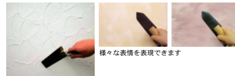
様々な表情を表現できます

カルクウォール 骨材0.5mm 25kg (約10㎡) 10kg (約4㎡) カルクウォール 骨材1.5mm 25kg (約5㎡)