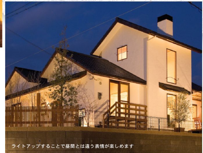
ライトアップすることで昼間とは違う表情が楽しめます